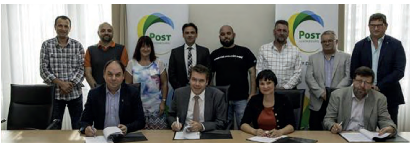
10 août 2016 signature de la convention collective 2.0

Après les élections de la délégation des salariés fin 2013 le Syndicat des P&T intéressé à redresser cette situation, s'est donné, en formant avec LCGB une coalition syndicale, les moyens pour devenir un acteur clé dans la négociation de la convention collective 2.0.